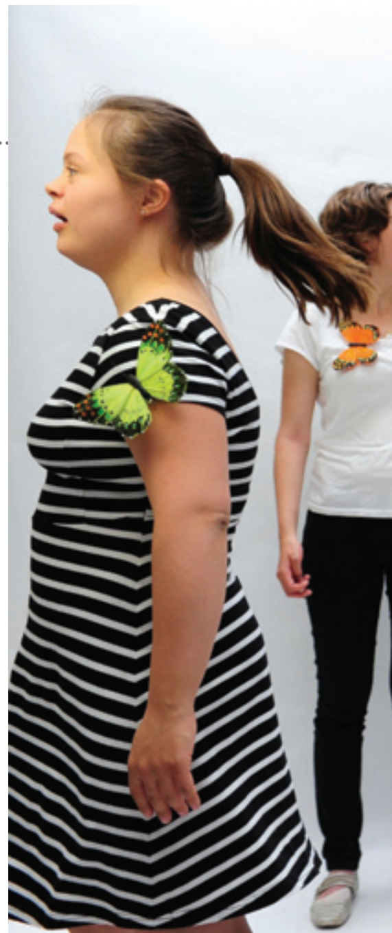
De deelnemers genieten enorm van het dansen. Begeleidster

Bij PUUR! wordt veel gebruikgemaakt van elementen uit hiphop en streetdance