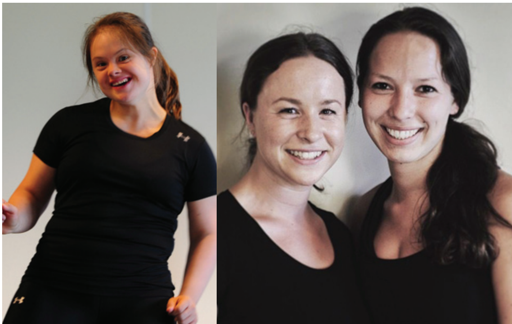
Dat PUUR! zich alleen richt op mensen met een beperking is uniek.