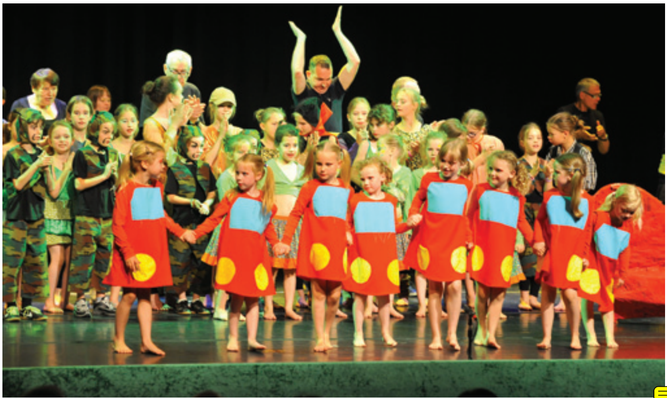
Elke twee jaar geeft dansschool Bailito een grote voorstelling waarin alle dansgroepen acte de présence geven.

dens de les en dat ze deze herhalen. Dat is altijd erg leuk om te zien!', vindt Petra.